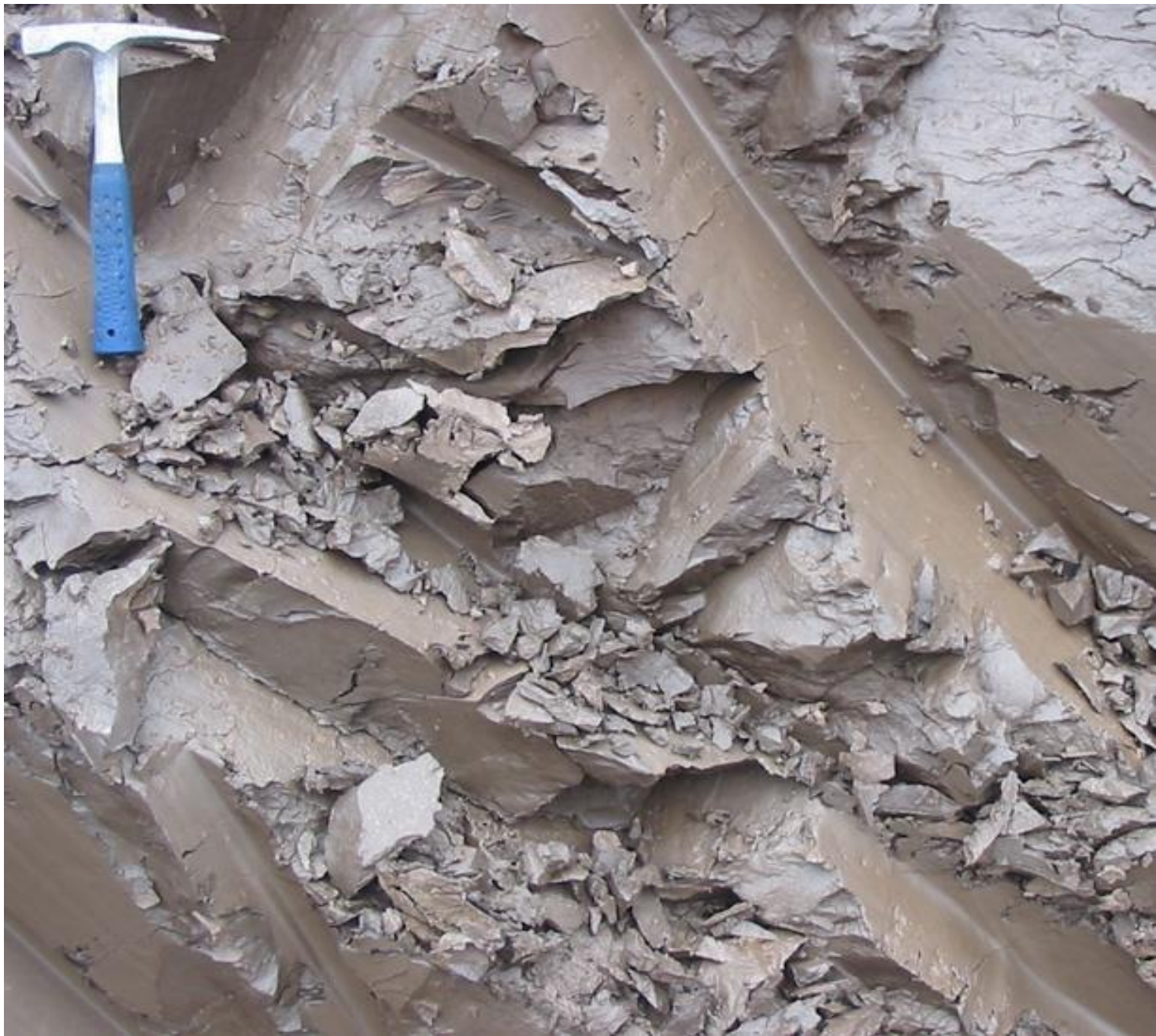
jíly v Estonsku