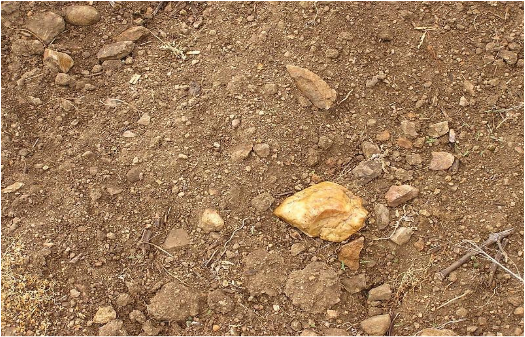
půda písčítá, kamenitá